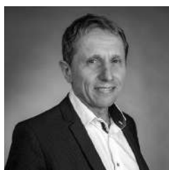
Table ronde - Dimanche 25 - 11h00 / 12h00 MOI, LA FORÊT ! Chapiteau Granier

Table ronde - Samedi 24 - 17h15/18h00 - Océans, Forêts, Humains, tous interdépendants ! Chapiteau Granier