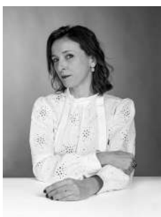
Table ronde - Samedi 24 - 15h45/17h00 - NUCLÉAIRE, TEXTILES, COMPENSATION, CROISSANCE VERTE...ÉCOLOGIE POUR DE VRAI OU GREENWASHING? Chapiteau Savoyarde

D'abord libraire (Librairie Le Square à Grenoble), puis assistante de fabrication au service Beaux Livres des Éditions Glénat, elle a ensuite exercé le métier de journaliste en presse écrite pendant 13 ans (outdoor et voyage). Elle a créé son activité au sein de la Coopérative d'Activité et d'Emploi Coodyssée dont elle est aujourd'hui entrepreneur-salariée associée. www.mapolloche.com