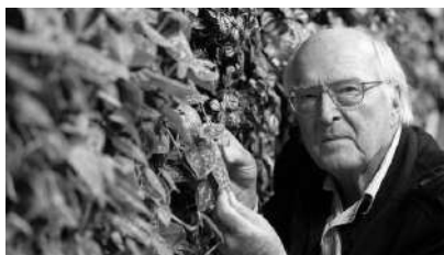
Table ronde - Dimanche 25 - 14h15 / 15h30 ET SI ON CHANGEAIT DE VIE ? Chapiteau Granier

Adrien Gygax est né en 1989 et vit en Suisse. Il est déjà l'auteur de deux romans, Aux noces de nos petites vertus (Cherche-Midi, 2017) et Se réjouir de la fin (Grasset, 2020). Départ de feu , est le roman de la Génération Y, où se mêlent confrontation avec la nature, urgence écologique, remise en question de nos modes de vie. Un roman très contemporain, pétillant et subtil.