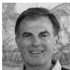
Table ronde - Samedi 24 - 09h45/11h00 - CONSOMMER ET PRODUIRE FACE AU DÉFI D'UNE PLANÈTE AUX RESSOURCES LIMITÉES Chapiteau Granier

co-auteur de l'Entreprise contributive : concilier monde des affaires et limites planétaires .