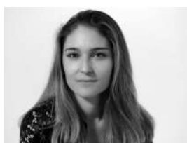
Table ronde - Samedi 24 - 09h45/11h00 - CONSOMMER ET PRODUIRE FACE AU DÉFI D'UNE PLANÈTE AUX RESSOURCES LIMITÉES Chapiteau Granier

co-auteur de l'Entreprise contributive : concilier monde des affaires et limites planétaires .